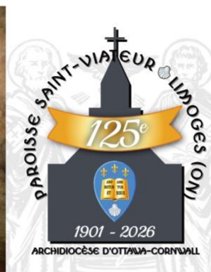
Commencement des festivités du 125 e anniversaire de la Paroisse Saint-Viateur